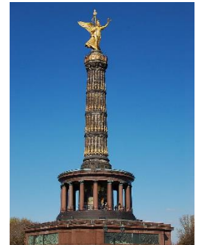
Innenstadt von Berlin

A2: ☺☺ Nennt Merkmale die Berlin als Bundeshauptstadt und Weltstadt charakterisieren. Teilt euch die Aufgabe auf und tauscht euch dann aus!