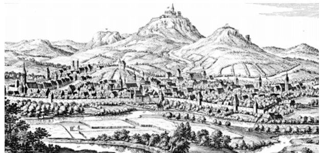
Eisenach um 1647