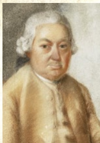
Carl Philipp Emanuel Bach

Lest die Textquelle von Bachs Sohn Carl Philipp Emanuel und füllt dann den Lückentext unten aus. So entsteht eine Lebensbeschreibung in moderner Sprache, der die wesentlichen Informationen über Johann Sebastian Bachs Herkunft enthält.