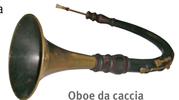
Oboe da caccia